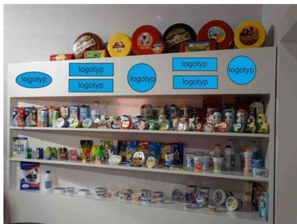
Gablota z opakowaniami produktów mleczarskich w strefie „Mleko na co dzień”